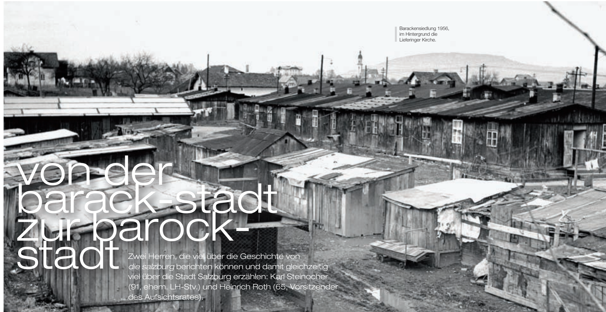
Barackensiedlung 1956, im Hintergrund die Lieferinger Kirche.